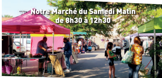
Notre Marché du Samedi Matin de 8h30 à 12h30

Téléphone : 03.21.74.08.13 mail : accueil@meurchin.fr Lundi: 13h à 17h Mardi, mercredi, jeudi et vendredi : 8h à 12h et 13h à 17h Samedi : 10h à 12h