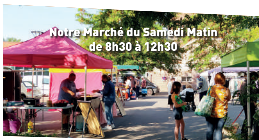
Notre Marché du Samedi Matin de 8h30 à 12h30

Téléphone : 03.21.74.08.13. mail : accueil@meurchin.fr Lundi: 13h à 17h Mardi, mercredi, jeudi et vendredi : 8h à 12h et 13h à 17h Samedi 6 et 13 avril, 11 et 25 mai de 08h à 12h