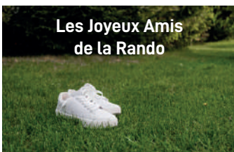
Les Joyeux Amis de la Rando

L'article R417-11 du Code de la Route réprime d'une contravention de 135€ , l'arrêt ou le stationnement très gênant d'un véhicule sur un trottoir, sur un passage piéton , au droit d'une bouche incendiée , sur une voie réservée aux bus , sur un emplacement réservé aux personnes handicapées ou aux transports de fonds , masquant la signalisation routière .