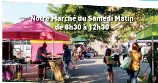
Notre Marché du Samedi Matin de 8h30 à 12h30

Téléphone : 03.21.74.08.13. mail : accueil@meurchin.fr Lundi: 13h à 17h Mardi, mercredi, jeudi et vendredi : 8h à 12h et 13h à 17h Les samedis 10 et 24 Février et 9 et 23 mars de 8h à 12h.