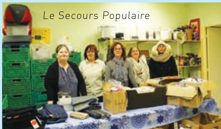
Le Secours Populaire

Les dernières ventes de vêtements organisées par le Secours Populaire et le Club féminin n'ont pas rencontré l'affluence espérée par les équipes organisatrices. Dommage car la qualité et la diversité étaient au rendez-vous.