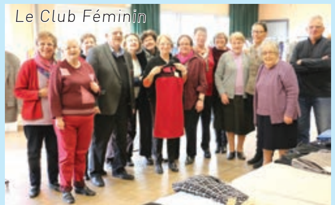
Le Club Féminin