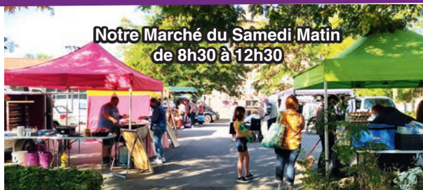
Notre Marché du Samedi Matin de 8h30 à 12h30