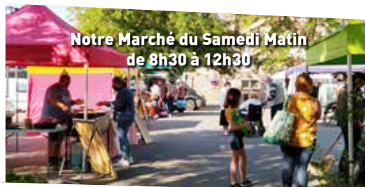
Notre Marché du Samedi Matin de 8h30 à 12h30