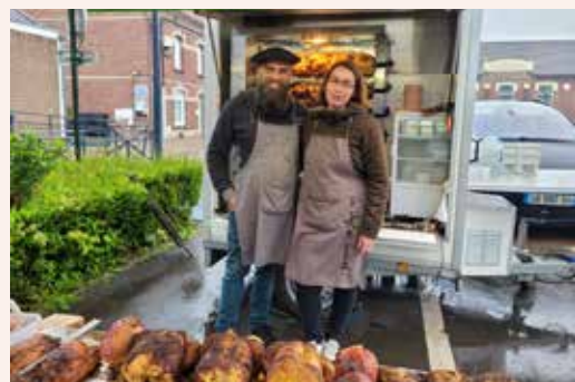
MEME LES JOURS DE PLUIE !!

POULETS et SAUCISSONS CHAQUE SAMEDI MATIN JOUR DE MARCHÉ ILS VOUS ATTENDENT SUR LA PLACE DE LA MAIRIE