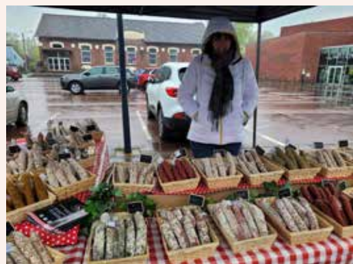
ILS VOUS ACCUEILLENT AVEC LE SOURIRE !!