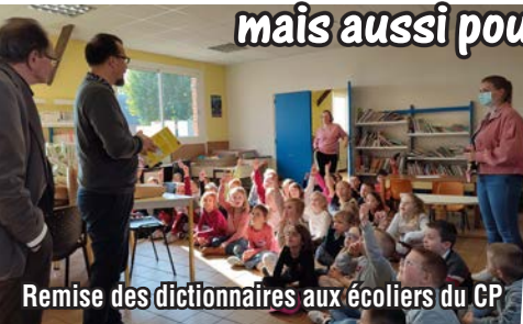
Remise des dictionnaires aux écoliers du CP

Les actualités s'enchaînent pour les plus jeunes mais aussi pour leurs aînés !!