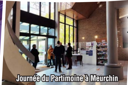
Journée du Patrimoine à Meurchin