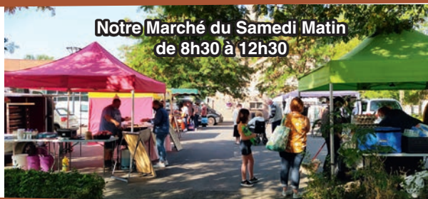
Notre Marché du Samedi Matin de 8h30 à 12h30