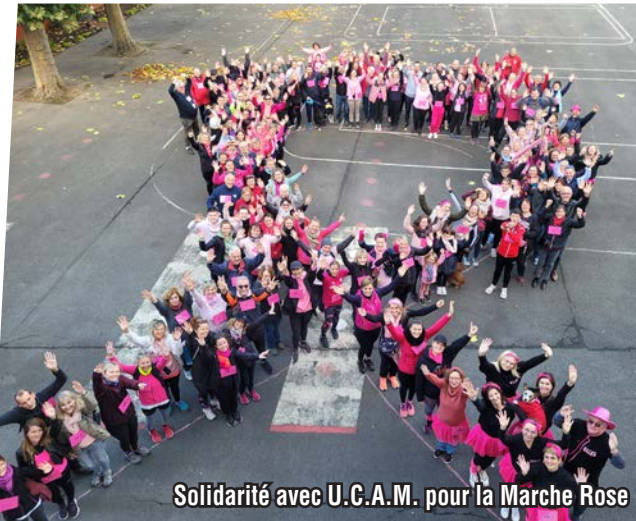
Solidarité avec U.C.A.M. pour la Marche Rose

Organisation de la Semaine Bleue pour nos seniors