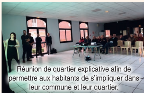
Réunion de quartier explicative afin de permettre aux habitants de s'impliquer dans leur commune et leur quartier.