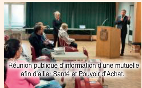
Réunion publique d'information d'une mutuelle afin d'allier Santé et Pouvoir d'Achat.