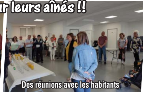
Des réunions avec les habitants