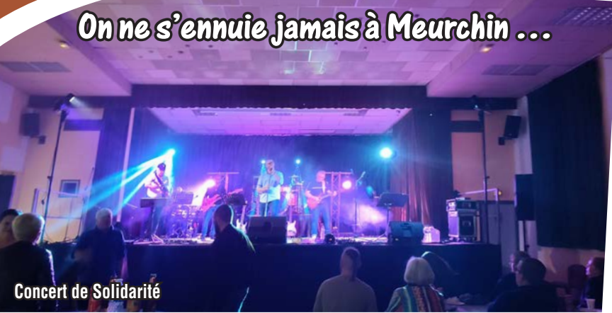
Concert de Solidarité