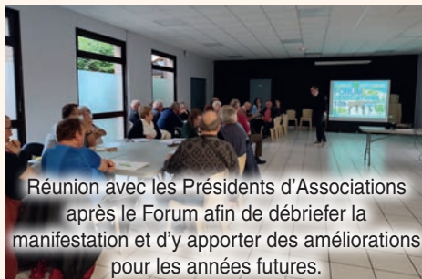
Réunion avec les Présidents d'Associations après le Forum afin de débriefer la manifestation et d'y apporter des améliorations pour les années futures.

Elles permettent aussi de remercier une partie de la population qui vient occasionnellement apporter son aide sous forme de bénévolat selon les diverses manifestations organisées sur la commune. Pour tout cela, merci à tous.