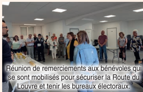
Réunion de remerciements aux bénévoles qui se sont mobilisés pour sécuriser la Route du Louvre et tenir les bureaux électoraux.